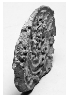
Fig. 1. Disco de plomo con inscripción (dibujo: R. Álvarez Arza)